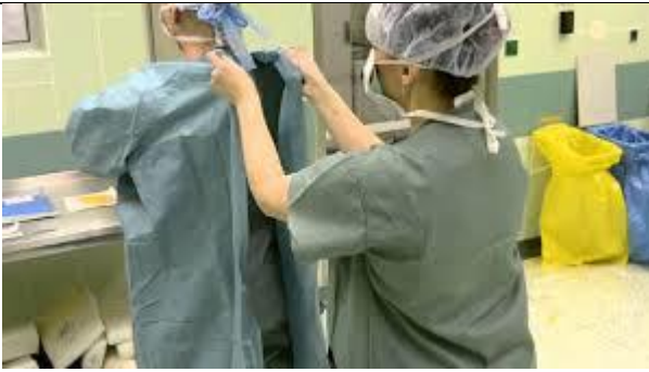
بستن بندهای گان توسط سیرکولار