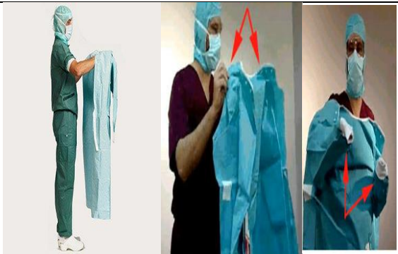
فروردن دست ها در آستین