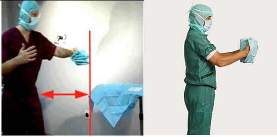
نگه داشتن گان در سطح گردن