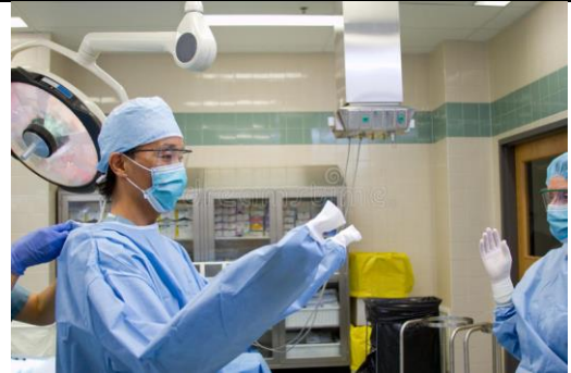
نگه داشتن دست ها در آستین گان